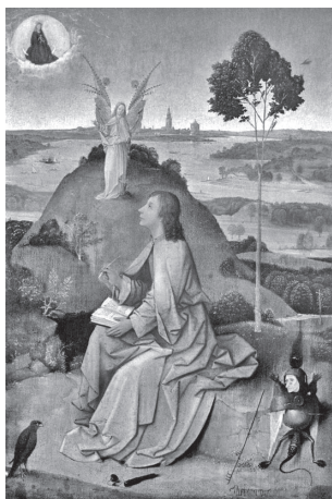
Рис. 2. «Святой Иоанн на Патмосе» (1504–1505), Иероним Босх URL: https://art.biblioclub.ru/picture_6664_svyatoy_ioann_na_patmose/ (дата обращения 15 августа 2023)

держанию перекликаются с самым идиллическим произведением Босха – «Святой Иоанн на Патмосе» (рис. 2, 3). Примечательно, что сам Иероним Босх состоял в католическом движении «Новое благочестие», достигшем своего расцвета в XV в. в основном в Нидерландах и Германии, выступавшем за религиозную реформу и ставшем в некотором смысле предтечей Реформации. Подвергая тогдашнюю Церковь критике, данное движение призывало к обновлению путем возвращения к подлинной вере и простоте жизни. Этот нюанс еще больше актуализирует творчество художника в современном мире.