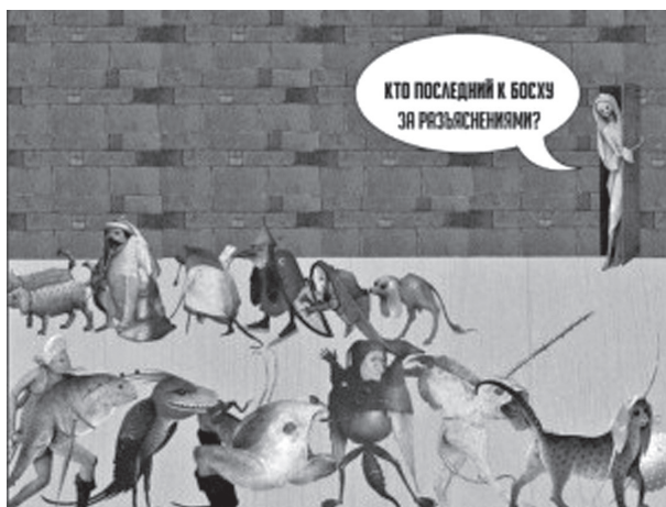
Рис. 6. Мем «Кто последний в очереди за разъяснениями?» URL: https://pikabu.ru/story/razbor_mema_sad_zemnyikh_naslazhdeniy_chast_1_6571818 (дата обращения 15 августа 2023)