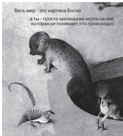
Рис. 4. Мем «Все мы немного нерпы»

Страх перед меняющимися нормами, включая границы личного и общественного, и перед бесконечным потоком разнообразной, зачастую противоречащей друг другу информацией – один из основных мотивов безымянных авторов «босхианских» мемов. Например, мем «Весь мир – это картина Босха, а ты – просто маленькая нерпа на ней, которая не понимает, что происходит» (рис. 4) – отсылка к комедии Уильяма Шекспира «Как вам это понравится» – «Весь мир театр, а люди в нем – актеры». Автор мема местоимением «ты» выделил каждого отдельно взятого человека, потерянного в сложном и непонятном ему мире.