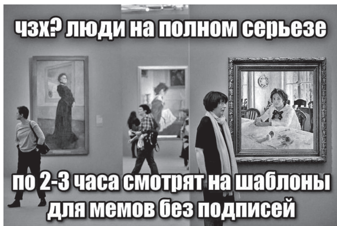
Рис. 1. Мем «ЧЗХ? Люди на полном серьезе...»

URL: https://pikabu.ru/story/gde_ya_10405217 2023