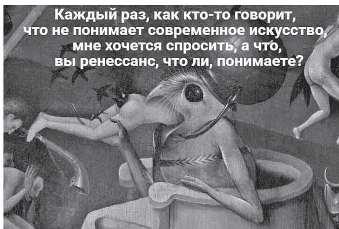
Рис. 7. Мем «Каждый раз, когда кто-то говорит...» URL: https://pikabu.ru/story/chto_khotel_skazat_avtor_4702184 (дата обращения 15 августа 2023)