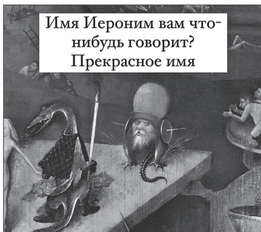
Рис. 5. Мем «Имя Иероним вам что-нибудь говорит?»

URL: https://pikabu.ru/story/ibragim_boskh_9290159