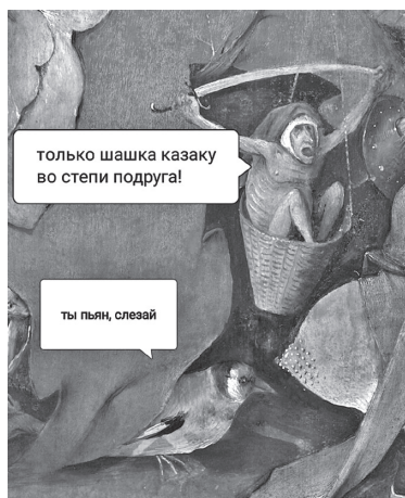
Рис. 9. Мем «Только шашка казаку во степи подруга» URL: https://pikabu.ru/story/leysya_pesnya_8854947 (дата обращения 15 августа 2023)

Изучая сетевое творчество по мотивам произведений художника, нельзя обойти вниманием и фотографии пользователей, с помощью подручных средств воспроизводящих образы с живописных полотен в интерьерах собственных жилищ. Сообщество «Изоизоляция», появившееся в самый разгар пандемии коронавируса в марте 2020 г., стало отражением арт-терапии, проводимой людьми на карантине, и стремлением справиться с тревогой через карнавализацию быта. Как отмечают организаторы группы в своей книге: