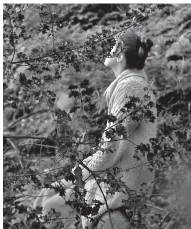
Рис. 3. Кадр из видеоролика «Путешествие к простой и стабильной жизни» (2019) URL: https://www.youtube.com/watch?app=desktop&v=X7tzLezgws8 (дата обращения 15 августа 2023)

Резкий слом представлений о дозволенном и о личных границах, эмоциональная нестабильность, нарастающая в современной цивилизации, связаны и с переосмыслением человеческих взаимоотношений на глобальном уровне. Люди XXI в. живут в мире, постепенно отвоевываемом «новой этикой». Деконструируя патриархальную модель, в рамках которой человеческое общество существовало всю прежнюю письменно зафиксированную историю, она переосмысляет взаимоотношения между людьми и формирует новый моральный кодекс, подвергая ревизии всю культуру. То, что